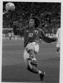
中村俊輔の足の指も人さし指が長い